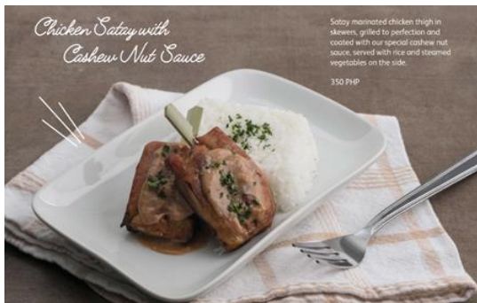
Chicken Satay with Cashew Nut Sauce