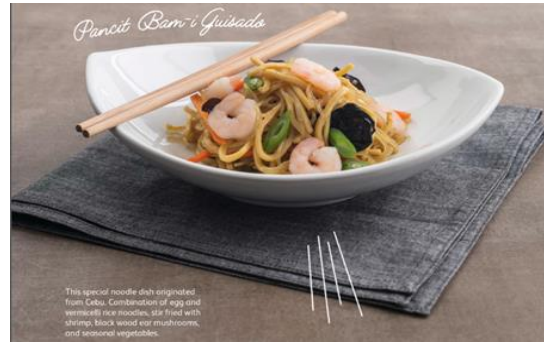
Pancit Bam-I Guisado