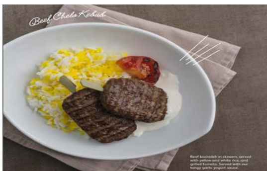
Beef Chelo Kebab