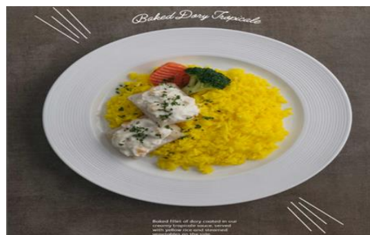
Baked Dory Tropicale