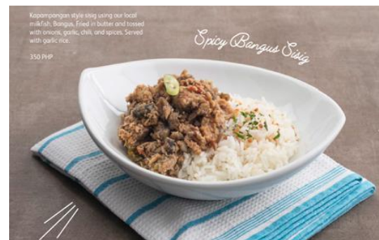
Spicy Bangus Sisig