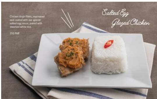
Salted Egg Glazed Chicken Rice