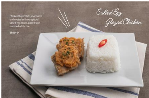
Salted Egg Glazed Chicken Rice