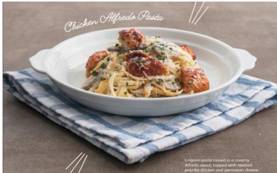
Chicken Alfredo Pasta