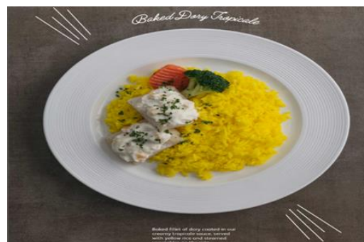
Baked Dory Tropicale