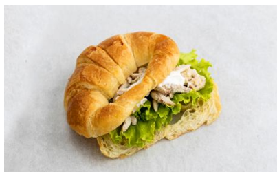
Chicken Caesar Croissant