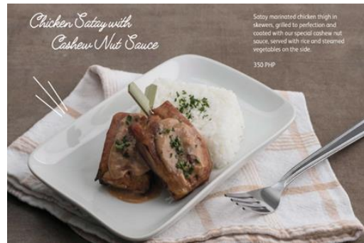
Chicken Satay with Cashew Nut Sauce