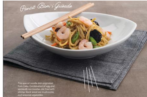
Pancit Bam-I Guisado