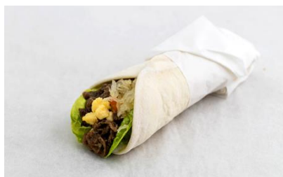
Beef Tapa & Egg Burrito