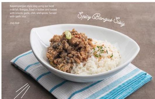
Spicy Bangus Sisig