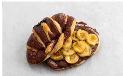
Hazelnut Banana Croissant