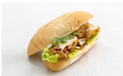
Salted Egg Chicken in Baguette