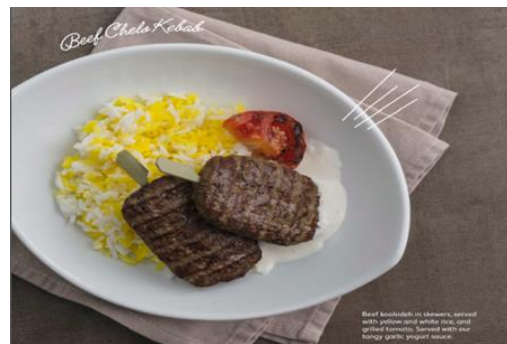
Beef Chelo Kebab