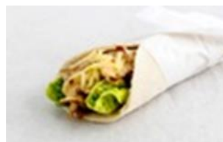
Chicken Inasal Burrito

Slices of grilled chicken with a colorful medley of tomato relish, red cabbage, and lettuce, in freshly baked herb bun.