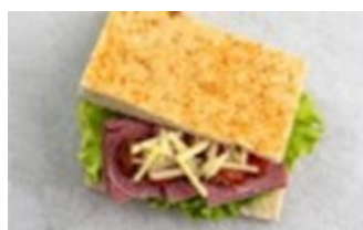
Beef Pastrami in Focaccia

Beef pastrami with tomato relish and lettuce, topped with cheddar cheese, in freshly baked rosemary and parmesan focaccia bread.