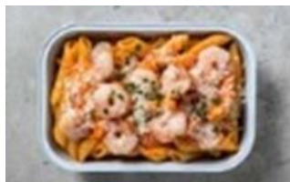
Shrimp Alfonso Pasta

Penne pasta tossed in our creamy Alfonso tomato sauce, topped with shrimp and parmesan cheese.