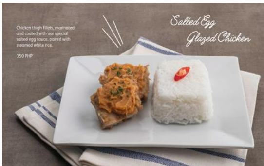
Salted Egg Glazed Chicken Rice