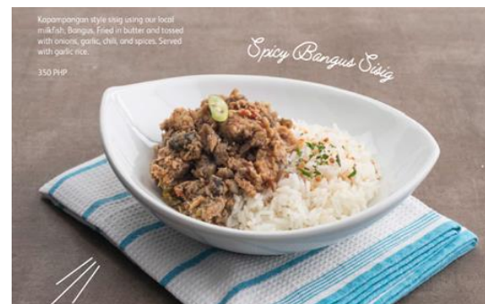
Spicy Bangus Sisig