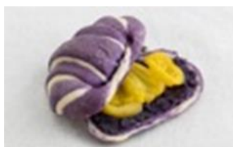
Ube Langka Croissant

Bacolod style chicken inasal, marinated with lemongrass and annatto, sprinkled with cheese and wrapped in a soft tortilla.