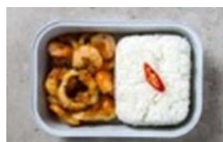
Stir-Fried Mixed Seafood with Salted Egg Sauce

Roasted fillet of dory with our classic Escabeche sauce, served with steamed white rice.