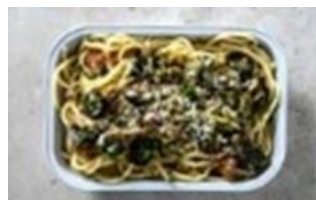
Tuna Pesto Pasta

Penne pasta tossed in our creamy Alfonso tomato sauce, topped with shrimp and parmesan cheese.