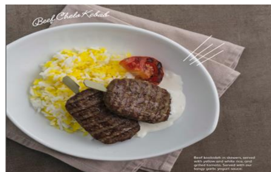
Beef Chelo Kebab