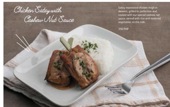
Chicken Satay with Cashew Nut Sauce