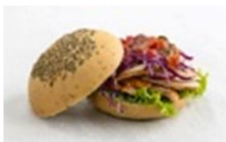
Grilled Chicken Herb Bun

Slices of grilled chicken with a colorful medley of tomato relish, red cabbage, and lettuce, in freshly baked herb bun.