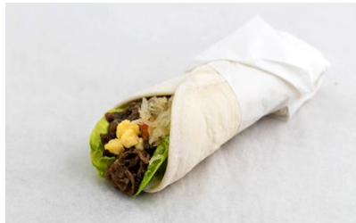
Beef Tapa & Egg Burrito