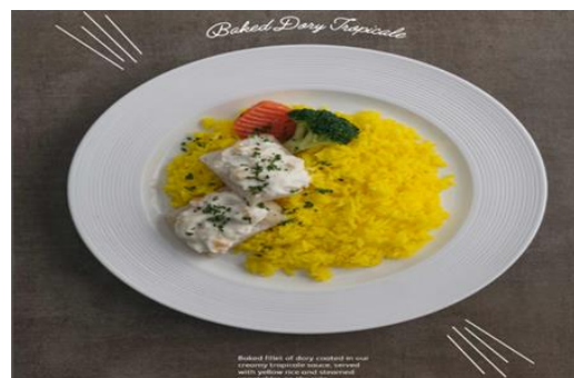
Baked Dory Tropicale