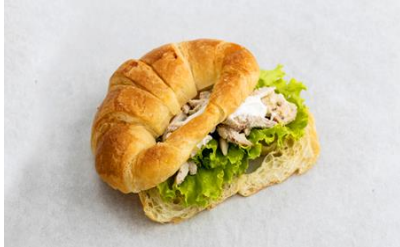
Chicken Caesar Croissant