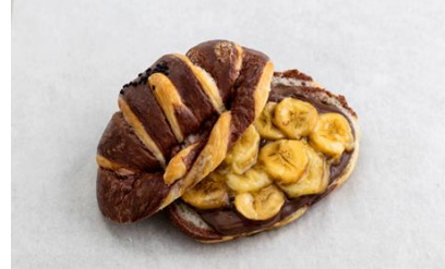
Hazelnut Banana Croissant