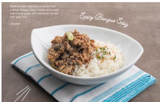
Spicy Bangus Sisig