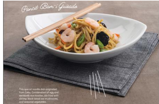
Pancit Bam-I Guisado