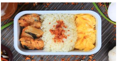
ミルクフィッシュ(白身魚)