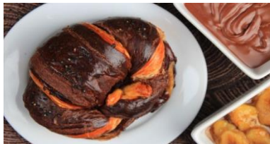
ヘーゼルナッツバナナクロワッサン