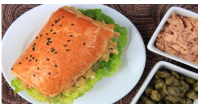
ツナ ケツパーパニーニ