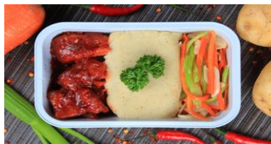
バッファローチキン/マッシュポテト