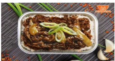
吉野家ビーフミソ