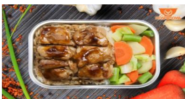
吉野家テリヤキチキン